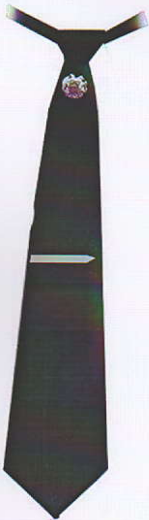
Նկ1. Փողկապ տղամարդու