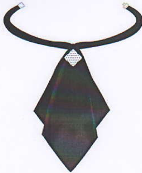
Նկ2. Փողկապ կանացի